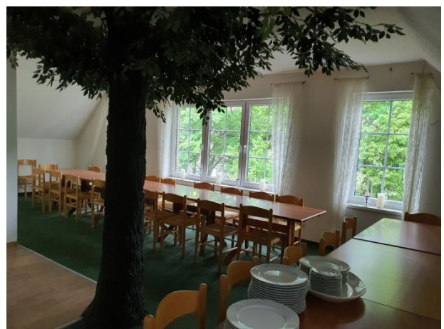
Veranstaltungsraum im 1. OG